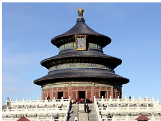
Храм Неба — символ Пекина